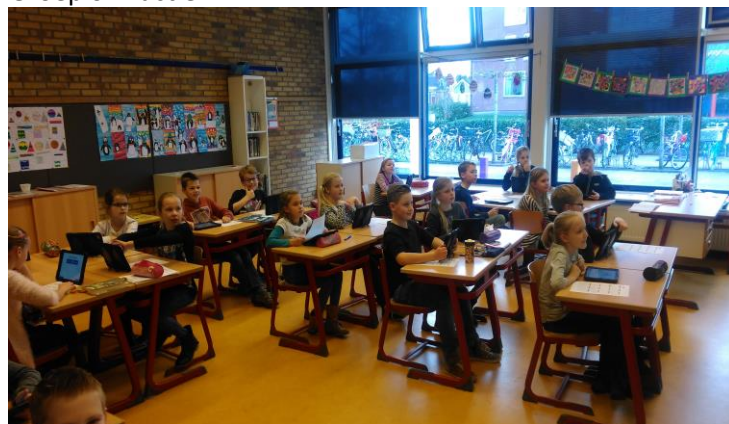
Groep 6 in actie.

'lastig' medium. Er wordt namelijk ook verkeerd gebruik van gemaakt. Foto's maken van anderen, 'gekke' berichten plaatsen en voor je het weet zijn er grote problemen. We zijn als school aan het kijken hoe we hier mee om willen gaan. De huidige afspraken zullen worden aangescherpt, zodat het voor iedereen leuk blijft. U wordt hier binnenkort volledig over op de hoogte gebracht. En, als het niet echt nodig is, laat het mobieltje gewoon thuis!